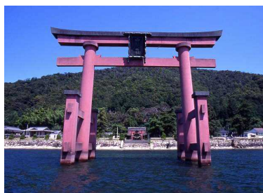
(上：石塔寺 下：白鬚神社)