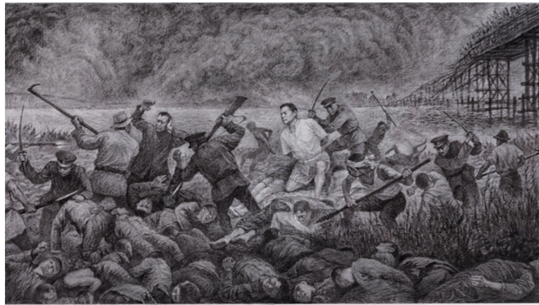
「関東大震災中国人虐殺之図」南京芸術学院 張玉彪教授画（油彩・2020年）

1923年9月1日の関東大地震は首都圏で死者10万人、住居焼失者200万人を超える、日本の地震災害史上最大の被害をもたらした。2日には「戒厳令」が